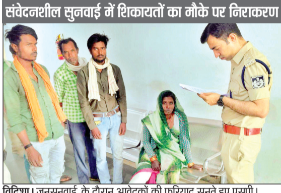
संवेदनशील सुनवाई में शिकायतों का मौके पर निराकरण विदिशा। जनसुनवाई के दौरान आवेदकों की फरियाद सुनते हुए एसपी।