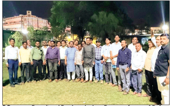
विदिशा। बाल विहार में आयोजित बैठक के दौरान लिए गए कई महत्वपूर्ण निर्णय।