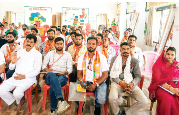
►► ग्यारसपुर

ग्यारसपुर मंडल में भाजपा द्वारा आयोजित पंडित दीनदयाल उपाध्याय प्रशिक्षण महाभियान का समापन हुआ। वक्ताओं ने पार्टी की विचारधारा, संगठनात्मक संरचना एवं जनकल्याणकारी योजनाओं पर विस्तार से प्रकाश डाला।