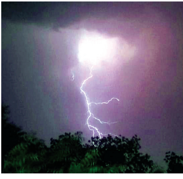
हरिभूमि न्यूज | गंजबासोदा

इलाके भर में सोमवार को शाम के समय तेज गरज चमक के बीच हल्की बारिश हुई। वहीं ग्राम फूफैर, सकराई, बलरामपुर, नेवली सहित आसपास के ग्रामों में लगभग एक